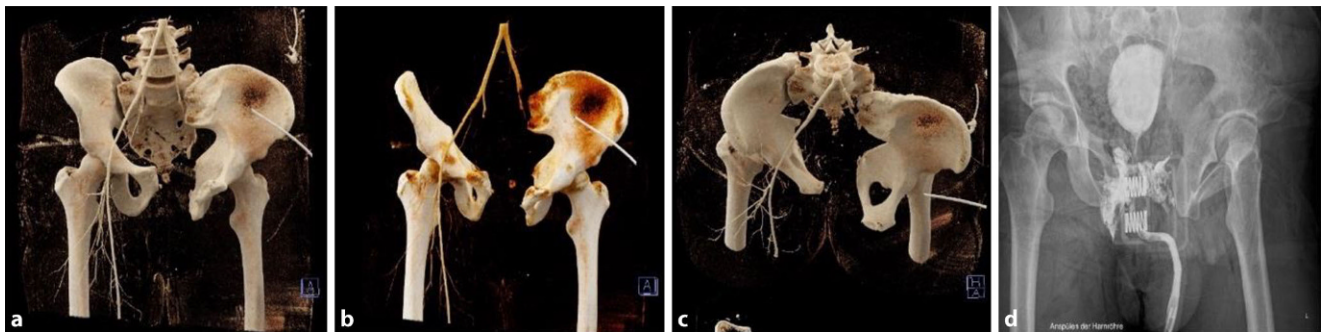
Abb. 1 ▲ 3D-Rekonstruktionen (DeepUnity Diagnost, Fa. Dedalus Healthcare Group, Mailand, Italien) des knöchernen Beckens (a.-p.- und axiale Aufnahme) (a–c), des Gefäßsystems sowie eine a. p.- Becken-Röntgenaufnahme (DigitalDiagnost, Fa. Philips, Amsterdam, Niederlande) des diffusen Kontrastmittelaustritts aus der Harnblase (d)

ist bereits eine akute traumatische Koagulopathie mit verlängerter Gerinnungszeit sowie auch einer verminderten Festigkeit des Gerinnsels ersichtlich. Inspektorisch war bei angelegtem Beckengurt ein III°-offenes komplexes Beckentrauma mit aktiver Blutung sowie ausgeprägtem Décollement der linken Flanke von sakroiliakal bis paraumbilikal festzustellen. Auffallend sind eine Pulslosigkeit und ein blasses Hautkolorit der linken unteren Extremität. Die Durchblutung der übrigen Extremitäten war intakt. In dem umgehend durchgeführten Ganzkörper-CT mit Kontrastmittel (Siemens Somatom, Fa. Siemens Healthineers AG, München, Deutschland) zeigten sich eine vollständige Dissoziation des linken Iliosakralgelenks sowie eine Sprengung der Symphyse.