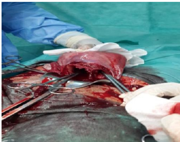
Figure 1: Une cloison séparant la cavité uterine