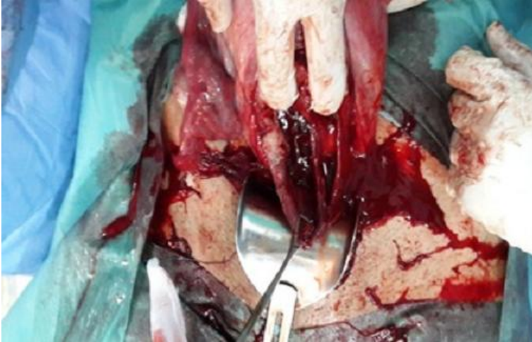
Figure 2: Cloison séparant le col utérin