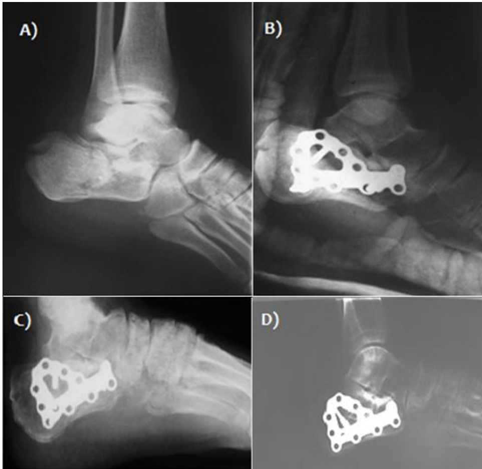
Figure 3: A) radiographie de cheville (profil) montrant une fracture du calcanéum stade IV; B) radiographie post opératoire- ostéosynthèse par une plaque anatomique en Y; C) contrôle radiologique de la fracture à 3 mois; D) contrôle radiologique de la fracture à un an