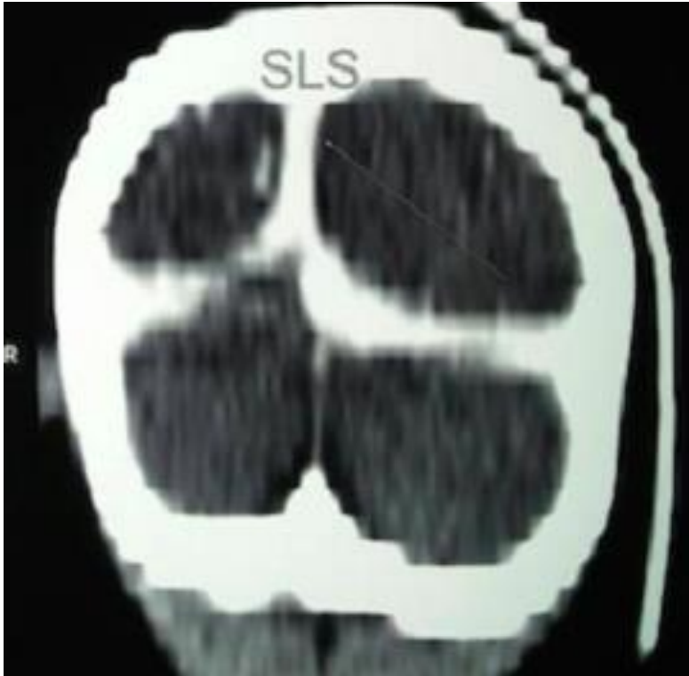
Figure 4: Scanner cérébral de contrôle montrant l'absence de thrombus au niveau du sinus longitudinal supérieur