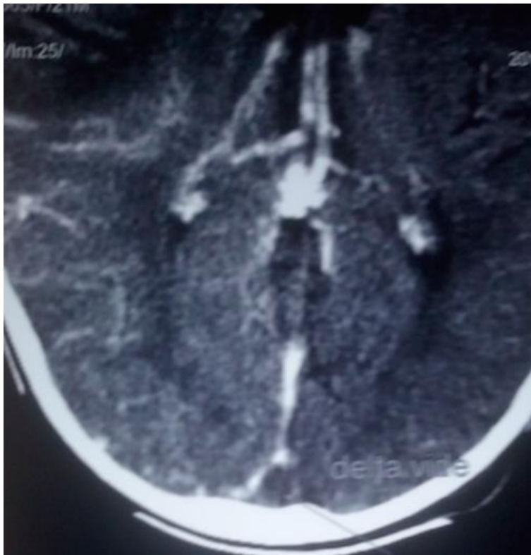
Figure 3: Scanner cérébral montrant le thrombus: signe du delta vide