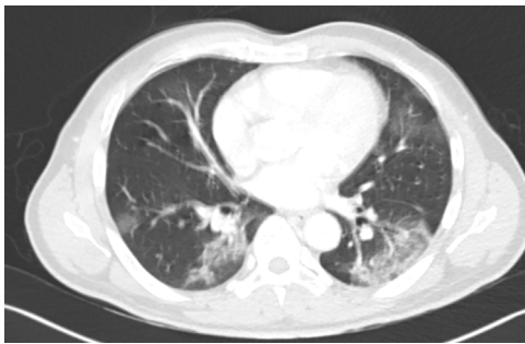
Figura 2 – Imagen de neumonía organizada con opacificación bilateral en vidrio esmerilado multilobar de predominio en lóbulos inferiores.

Este caso clínico nos muestra la importancia de revisar, en el momento actual, durante la anamnesis, la posibilidad de existencia de síntomas respiratorios en pacientes inicialmente orientados para valoración quirúrgica. Este cribado es de importancia para evitar contagios con pacientes, ya no solo asintomáticos, sino también con pacientes infectados. Cualquier medida que pueda servir para paliar la enfermedad de los profesionales es necesaria en el momento actual. Otro aspecto a destacar es la afectación abdominal no tan frecuente en el paciente afectado de COVID-19. En la actualidad, se ha descrito este tipo de afectación, sin embargo, no se han descrito, por el momento, complicaciones derivadas de la afectación gastrointestinal, como podrían ser perforación, isquemia o hemorragia gastrointestinal. Otro dato que se conoce es que los pacientes afectados de COVID-19 podrían ser transmisores por las heces, sugiriéndose como posible método diagnóstico 5,9 . En este sentido, y en el momento actual, deberíamos ser vigilantes en pacientes que presenten tos y fiebre alta en el momento de la exploración anal.