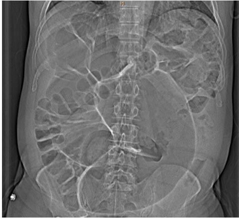
Figura 1 – En esta imagen podemos observar la gran distensión de colon, pudiendo ser compatible con un cuadro de colitis infecciosa.