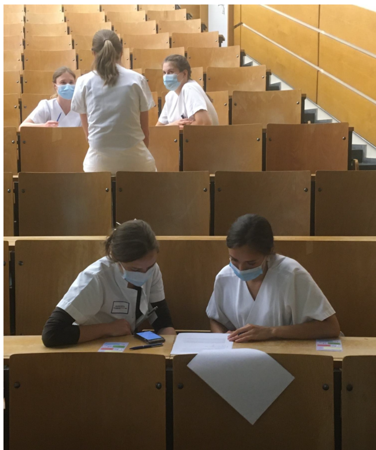
Figure 2: Case work in interprofessional (IP) pairs under pandemic conditions. Registered nurse answers a question of the IP team in the background.

I-reCovEr and its evaluation are presented and compared to the evaluation of the IPAPAED.