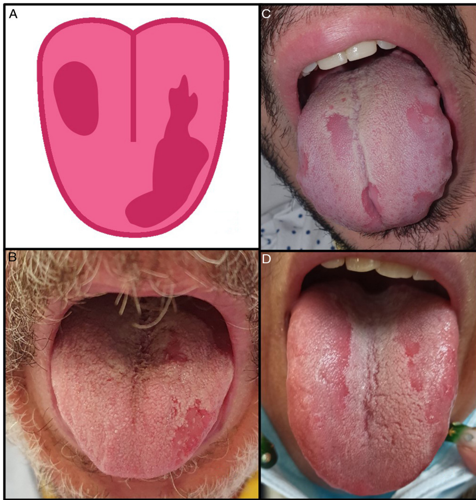
Figura 2 Pacientes con enfermedad por COVID-19 con glossitis con depapilación en parches (3,9%). A) Ilustración de la glossitis con depapilación en parches observada en pacientes COVID-19. B-D) Pacientes que presentaban glossitis con depapilación en parches. Los cultivos para hongos y las serologías fueron negativos.

Previamente, ya habían sido descritas la aparición de úlceras o aftas orales en relación con la COVID-19, incluso como un signo precoz de la infección 16,17 ; la mucositis y las aftas orales se han relacionado con otras infecciones víricas, como el herpes simple o el citomegalovirus.