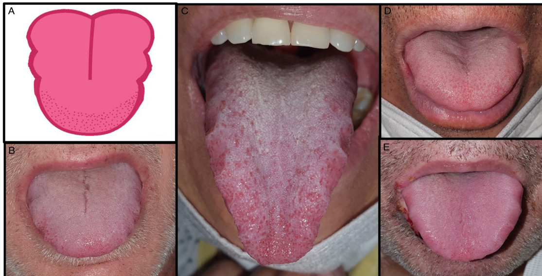
Figura 1 Pacientes con enfermedad por COVID-19 con un característico edema lingual o macroglosia (6,6%) asociado a papilitis lingual transitoria en U (11,5%). A) Ilustración de los cambios en la lengua con la marcación de las indentaciones en los laterales de la lengua e inflamación de las papilas anteriores probablemente por el roce. B-E) Pacientes con edema lingual y papilitis lingual transitoria en U durante la enfermedad COVID-19.

Otro hallazgo muy característico es la glositis con depapilación en parches en un 3,9% de los pacientes. Este hallazgo ha sido reportado previamente en algún caso aislado, curiosamente asociado a boca urente 14 . Recientemente, se ha denominado a este tipo de lengua «lengua COVID» 15 ; se parece a la lengua geográfica pero su incidencia está aumentada en pacientes con COVID-19. Su aparición puede deberse a la infección directa del virus en la lengua por los receptores ACE-2 o por el aumento de interleucina-6 que presentan los pacientes con COVID-19 pero también los pacientes lengua geográfica; hacen falta futuros estudios para conocer mejor esta relación y su posible etiopatogenia.