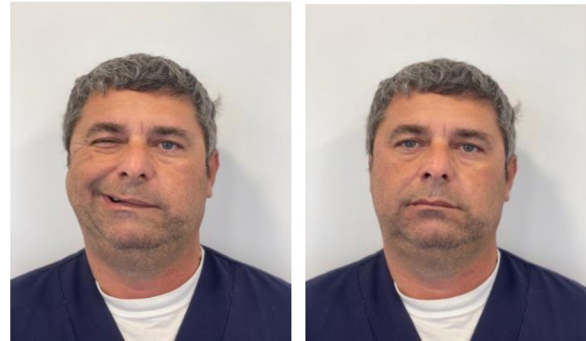
Figura 1 Paciente con parálisis de Bell.

En Urgencias fue diagnosticado de parálisis facial y derivado a consulta externa de Neurología (fig. 1).