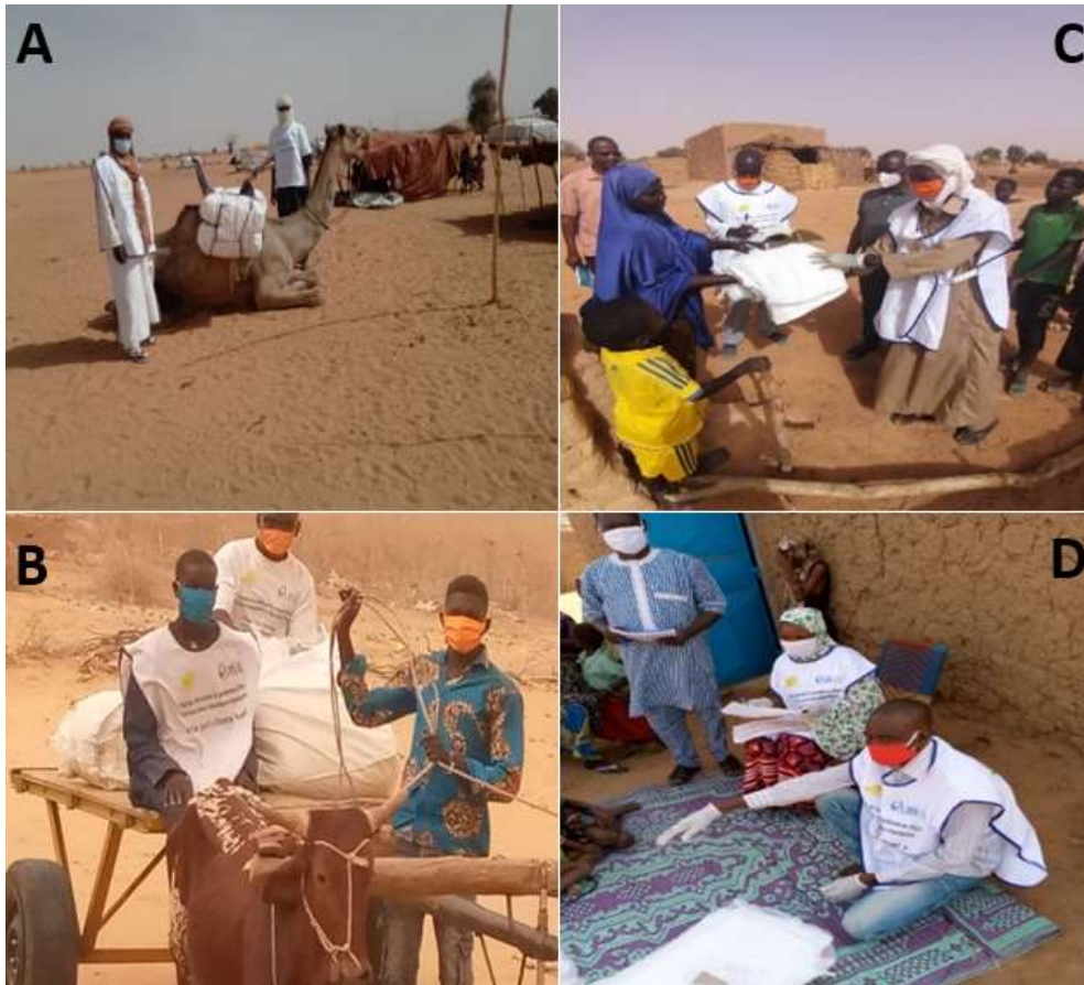
Figure 1: campagne de distribution des moustiquaires imprégnées d’insecticides à longue durée d’action adaptée au contexte avec respect des mesures de protection contre la COVID-19 (Niger, du 05 au 10 juin 2020)