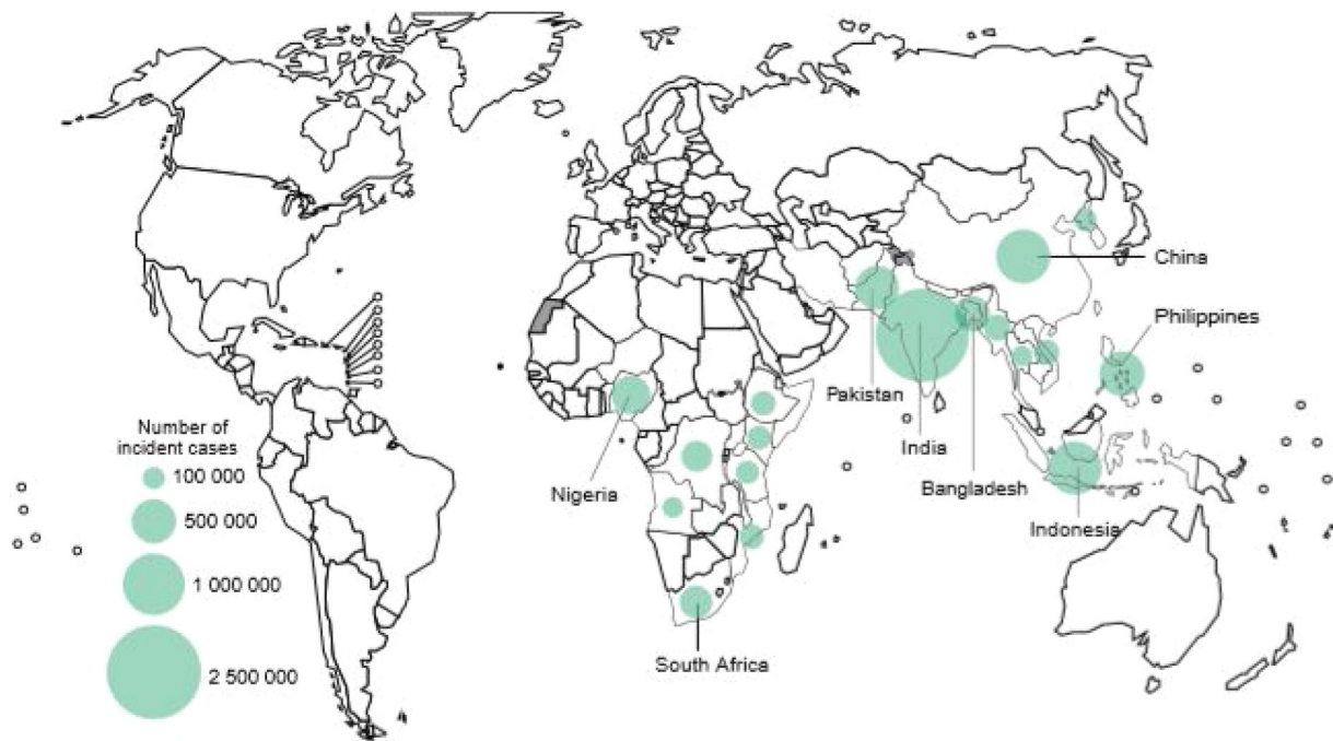
Figura 1. Incidencia estimada de TB en 2018, para países con al menos 100.000 casos incidentes.

casos notificados en España en el año 2019 fue de solo 9,4 casos por 100.000 habitantes 3 , aunque existe un subregistro importante 4,5 .