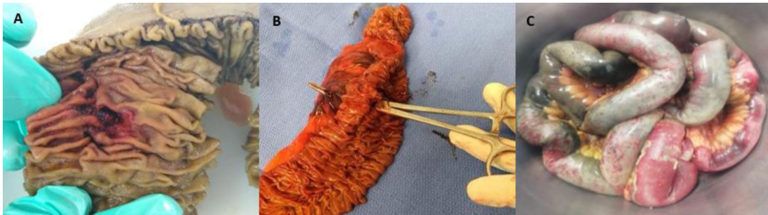
Figura 2 A) Espécimen quirúrgico de resección de yeyuno que muestra perforación total. B) Intestino delgado reseccionado, mismo paciente, mostrando perforación total y hematoma en el mesenterio. C) Intestino delgado reseccionado; se pueden observar áreas irregulares de necrosis.

reportes de caso único 5-13 . Norsa et al. también publicaron una serie de casos de 7 pacientes 14 , pero ofrece poca información sobre diagnóstico, hallazgos quirúrgicos y tratamiento previo. En una serie de casos presentada por Gao et al. 15 , describieron a 4 pacientes con abdomen agudo, quienes eran sospechosos de infección SARS-CoV-2, pero finalmente dieron negativo. Ignat et al. 16 reportaron una serie de casos de 3 pacientes que desarrollaron isquemia intestinal, mientras estaban hospitalizados por infección SARS-CoV-2 en Francia. Sin embargo, no mencionan el intervalo de tiempo entre admisión y el desarrollo del abdomen agudo, o el manejo previo durante la hospitalización. Kaafarani et al. 17 presentaron una serie de casos de 141 pacientes graves, describiendo complicaciones gastrointestinales relacionadas con infección SARS-CoV-2, de los cuales 5 pacientes (3.54%) presentaron isquemia intestinal. Finalmente, Bhayana et al. 18 presentaron una serie de casos de orientación radiológica que incluyó detalles quirúrgicos y radiológicos de 4 pacientes SARS-CoV-2 con trombosis mesentérica. Toda la literatura publicada y detalles disponibles aparecen en la tabla 4 , excepto el estudio de Kaafarani et al. Su serie de casos fue excluida de la tabla debido a la falta de detalles individuales de los pacientes y de especificación de resultados de supervivencia. Hasta donde sabemos, la nuestra es la primera serie de casos completa sobre el tema.