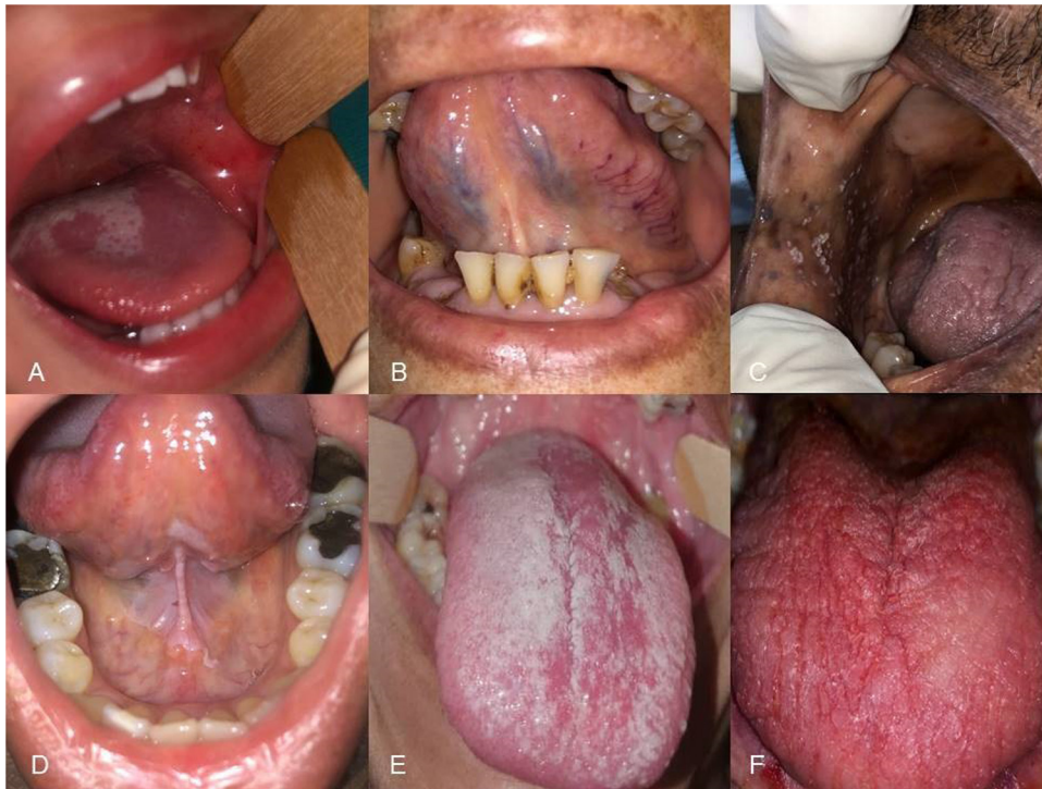
Figura 2 Lesiones orales en pacientes COVID-19. A) Glositis migratoria y petequias en carrillo. B) Varicosidades linguales unilaterales. C) Candidiasis pseudomembranosa. D) Leucoplasia en piso de boca y cara ventral de lengua (paciente no fumador) E) Candidiasis pseudomembranosa. F) Candidiasis eritematosa.

en 7 pacientes (12,7%), y una queilitis angular grave en un paciente (fig. 1B). Todos ellos fueron tratados con antimicóticos tópicos y sistémicos. El paciente con queilitis angular se trató con una mezcla tópica de antibiótico y antimicótico.