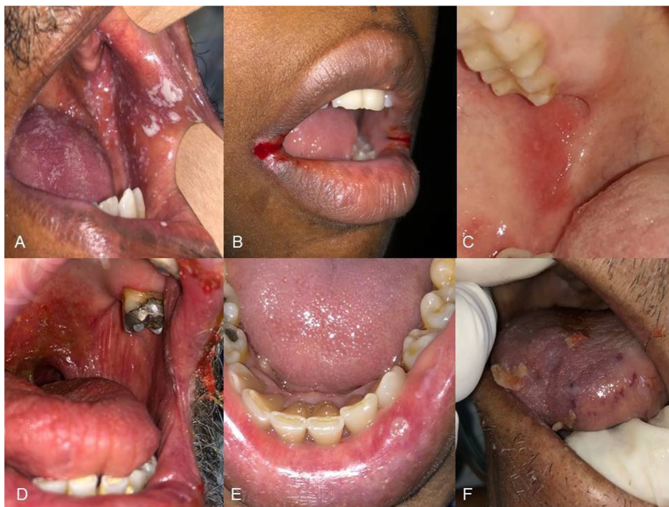
Figura 1 Lesiones orales en pacientes COVID-19. A) Candidiasis pseudomembranosa. B) Queilitis angular. C) Enantema en carrillo. D) Úlceras en paladar blando y xerostomía. E) Úlcera labial «aftoide». F) Úlceras hemorrágicas en lengua.

incluyendo la piel y las mucosas. Las lesiones de la mucosa oral han sido descritas en pocos trabajos 1 , y aún no está claro si son producto de los tratamientos usados para la enfermedad, la alteración inmunológica que provoca el virus u otros factores, como los niveles altos de estrés que genera estar infectado. La presencia tanto de receptores ACE2 y TMPRSS2 2,3 como de la proteína Spike del virus 4 en la mucosa bucal sugiere que existe un efecto directo del virus en algunas de las manifestaciones orales observadas.