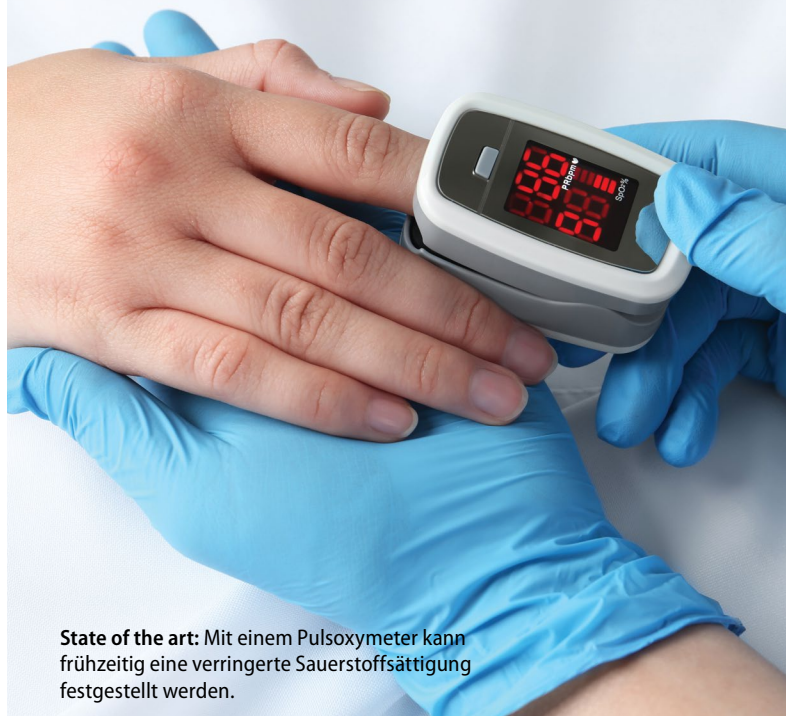
State of the art: Mit einem Pulsoxymeter kann frühzeitig eine verringerte Sauerstoffsättigung festgestellt werden.

Mit Pulsoxymetern kann eine Minderung der Sauerstoffsättigung einfach und frühzeitig detektiert werden (RKI 2021; Kluge et al. 2021). Erst ein Verständnis dafür, wie sich Bewohner*innen mit COVID-19 fühlen und wie sie sich äußern, kann eine frühzeitige Identifizierung und die Einleitung geeigneter Maßnahmen primär