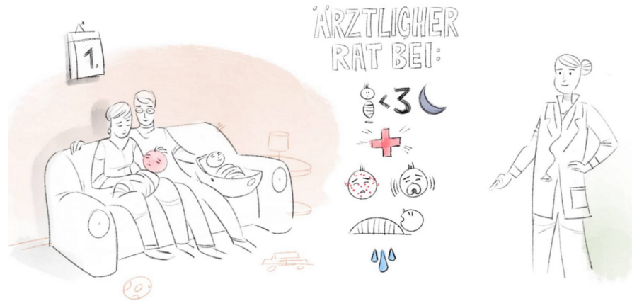
Abbildung 1: Standbild aus dem Videoclip, Empfehlung wann ärztlicher Rat eingeholt werden sollte

gen Stichprobe ausgewählt, zudem wurde die Alphafehler Kumulierung mithilfe der Bonferroni-Korrektur neutralisiert. Die Fallzahlberechnung für eine zweiseitige Prüfung im McNemar-Chi-Quadrat-Test nach Connett et al., ergibt: Mit einer globalen Irrtumswahrscheinlichkeit von 5% und einer Power von 80% und der Annahme, dass 10% von Bejahung zur Verneinung wechseln und 25% umgekehrt, benötigt man insgesamt 118 Probanden, die an beiden Befragungen teilnehmen. Aufgrund der 22 zu beantworteten Fragen (multiples Testen), wurde die Signifikanzgrenze des globalen Alpha von 0.05 auf 0,00227 für den einzelnen Wissensaspekt gesetzt. Bei Temperaturangaben konnten ein Mittelwert Vergleiche mithilfe eines T-Tests für verbundene Stichproben angewendet werden. Die Tests wurden jeweils mit einem Signifikanzniveau von p > 0,05 durchgeführt, alle weiteren Voraussetzungen waren erfüllt. Die Bewertung des Videos wurde rein deskriptiv ausgewertet, da es sich nicht um Vergleichsdaten handelte. Die Freitexte wurden mithilfe einer Zusammenfassungsmaske, in welcher zusätzlich die Häufigkeiten der Nennungen ähnlicher Aussagen berücksichtigt wurde, ausgewertet.