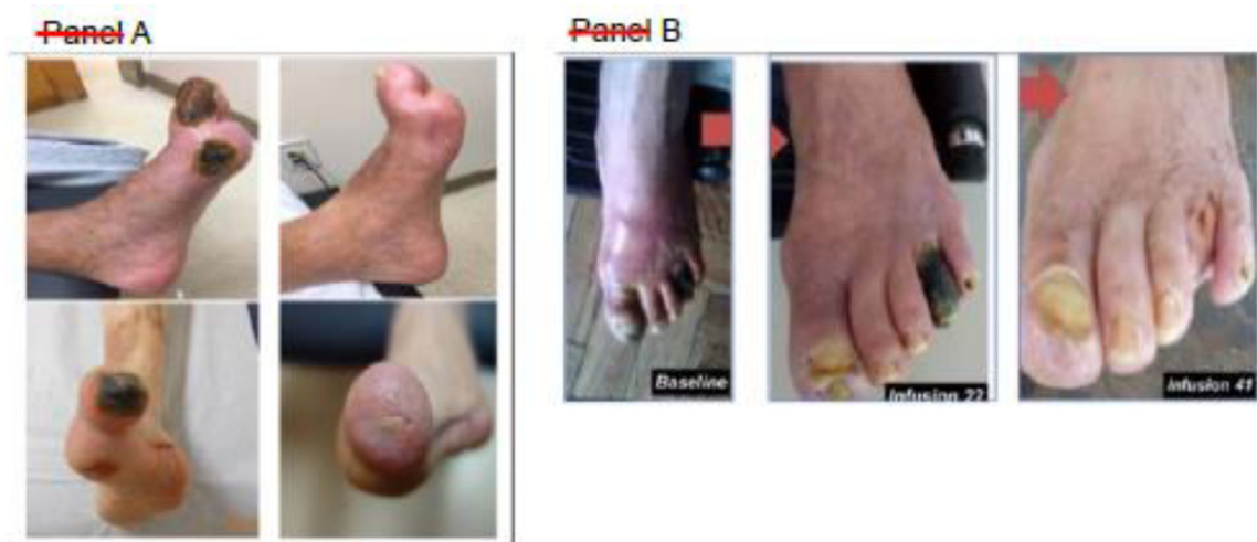
Figura 3. Fotos de pacientes con enfermedad arterial periférica grave al inicio y tras repetidas infusiones del agente quelante EDTA (etilendiaminotetraacetato) disódico de un paciente de Miami, Estados Unidos (A, reproducido con permiso de Arenas et al. 87 ) y Rosario, Argentina (B, reproducido con permiso de Ujueta et al. 88 ).