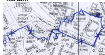
Figur 2. Exempel på hur en gångtur kan markeras på kartan.