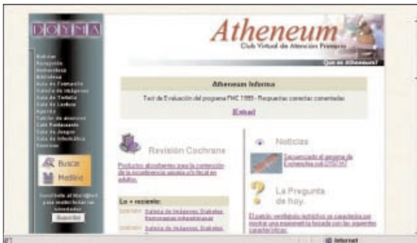
Figura 1. Pantalla de la página inicial de Atheneum.

Hablamos del primer sitio que apareció con vocación de portal. Orientado a la información con una sección de actualidad y archi-